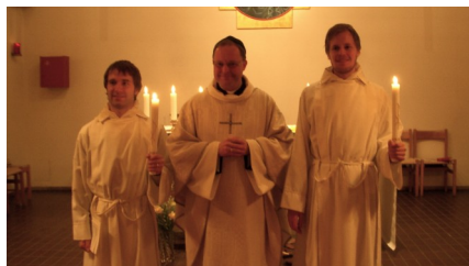
Konfirmation i påsknattsliturgin